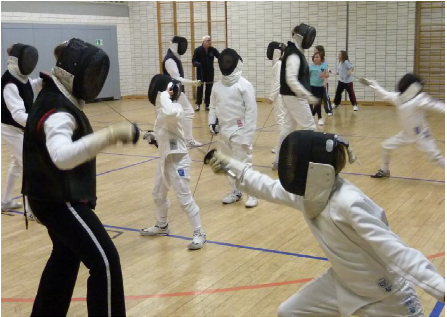
Beim Schnupperkurs können sich die Teilnehmer einen Eindruck über das betreuungsintensive Training des KHC-Fechtnachwuchses verschaffen.